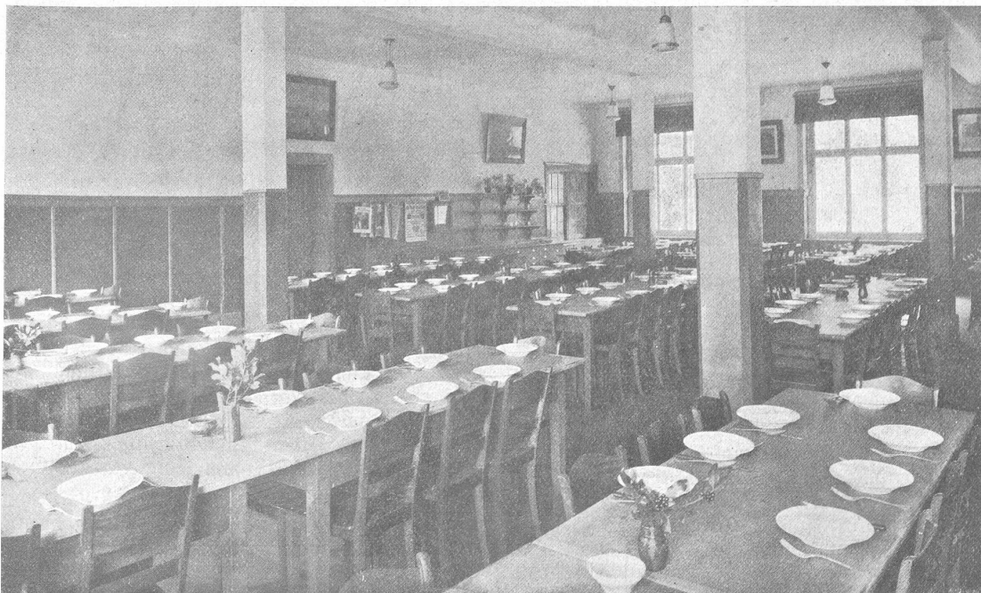
Wohlfahrts- und Pensionatshaus „Schmelzhof“ Klus der L. von Roll'schen Eisenwerke Klus-Balsthal. — Eßsaal.