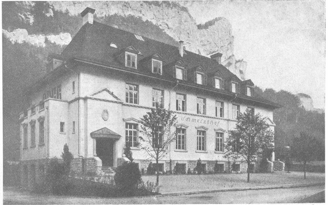
Wohlfahrts- und Pensionatshaus „Schmelzhof“ Klus der L. von Roll'schen Eisenwerke Klus-Balsthal. — Außenansicht.

Pädchen und können beim Fortgehen nur mit einem wortlosen Händedruck danken. — Der nächste Mittag vereinigt um lichterhelle Tafel die Pensionäre des Foners. Auch zu ihnen kommt das liebevolle Christkindgespann. Der dritte Tag ist der große Tag der Weihnachtsfeier. Der große Saal von nahezu 400 Gästen dicht besetzt, vorn die Schulen von Ch., begleitet von den italienischen Lehrbrüdern und den Walliser Lehrschwestern in ihrer kleidsamen Tracht, Mütter und Väter mit den kleinen Ein- bis Dreijährigen auf dem Arm, die Pensionäre als Stammgäste des Foners, Arbeiter, Angestellte, Ingenieure, Chemiker, auch die Direktion der Aluminium-Werke ist