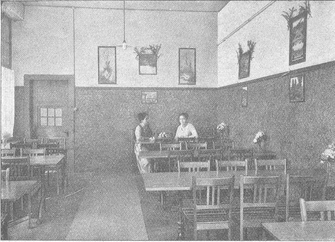
Arbeiterstube der Weberei Grüneck.

hat, ist darin vertreten. Andachtsvolle Stille herrscht im Saal, während der Engel den lagernden Hirten erscheint, die farbenprächtigen Könige vorbeiziehen und die bildhaft schöne Gruppe von Maria und Josef Auge und Ohr gefangen halten. Es ist, als ob Groß und Klein das Wunder von Bethlehem wirklich miterlebte.