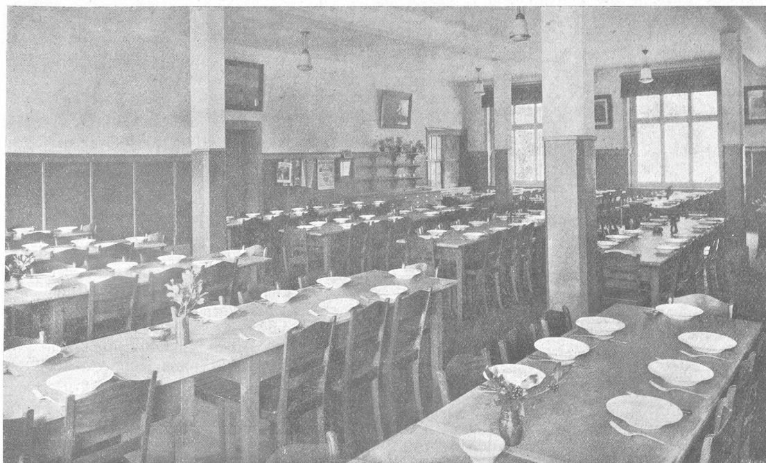
Wohlfahrts-Haus „Schmelzhof“ Klus der L. von Roll'schen Eisenwerke Klus-Balsthal. — Eßsaal.