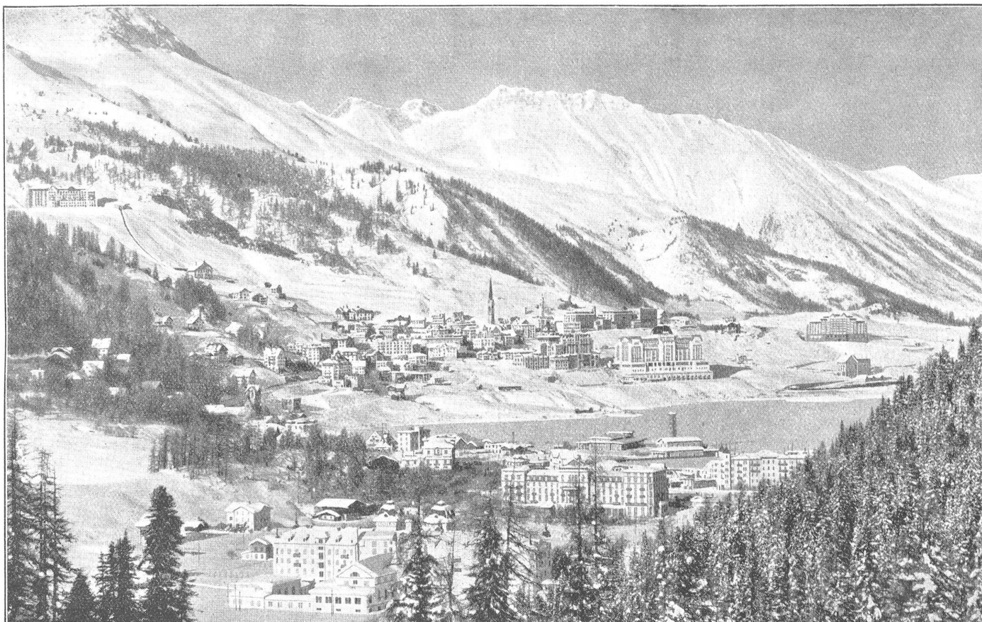
St. Moritz im Winter.

wie der, wird es bei dir nicht aushalten; da wär ich anders veranlagt. Wo ist er?"