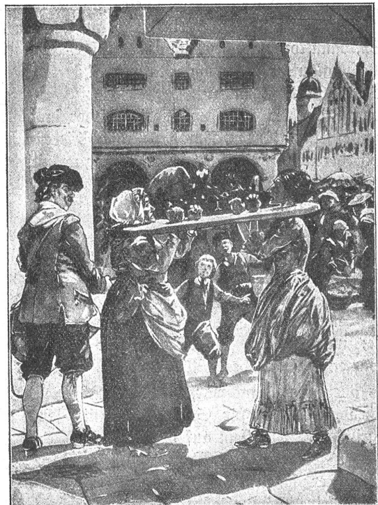
(Sig. 2.) Die Doppelgeige.

Einerseits kam die auch dem modernen Strafrecht als Nebenstrafe bekannte Entziehung bürgerlicher Ehrenrechte zur Anwendung. Dieser Strafe, die ja nicht die soziale Ehre des Verurteilten treffen soll, sondern ihm bloß solche Rechte