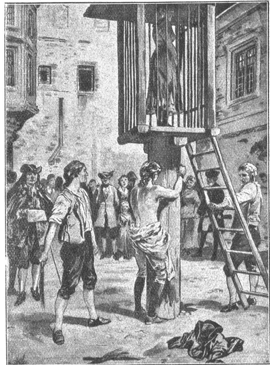
(Fig. 4.) Pranger und Staupenichlag.

Die Trülle (Fig. 1) bestand in einem großen, auf einer Spindel frei beweglichen Käfig, in dem man den Eingesperrten zur Belustigung des Publikums so lange herum-