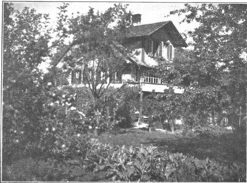
Das bisherige Krankenasyll-Gebäude in Gwatt.

ihren Lebensabend gefunden. Mögen die Freunde und Gönner in Strättligen und Thun dem Asyl treu bleiben und sich in Steffisburg mehren, um mitzuhelfen den Fortbestand der segensreichen Anstalt zu erleichtern. G.r.