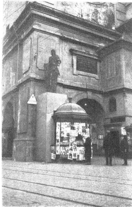
Wie sich das Bubenbergsdenkmal beim „Zytgloggen“ ausnehmen würde.