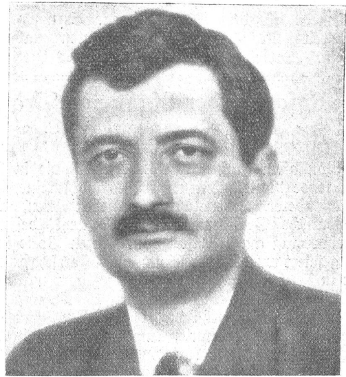
Prof. Hermann Oberth, der Konstruktor der Weltraumrakete. Er plant zunächst den Abschluß einer Rakete ohne Menschen bis 40 Kilometer Höhe.

ist, die Rakete so zu bauen, daß der Brennstoff in beschleunigtem Tempo verbrennt, so glaubt man auch, in höheren Regionen allmählich die nötige „kosmische“ Geschwindigkeit