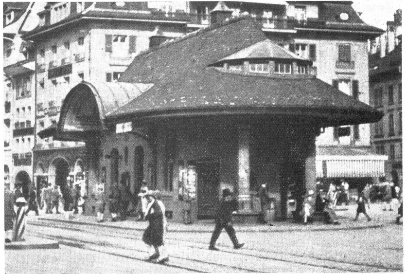
Das bisherige Tramwarthehaus.

Anmerkung der Redaktion. Ueber die „Umgestaltung des Bubenberglplatzes“ bringen wir auf Seite 195 der heutigen Nummer noch einen Aufsatz mit Illustration.