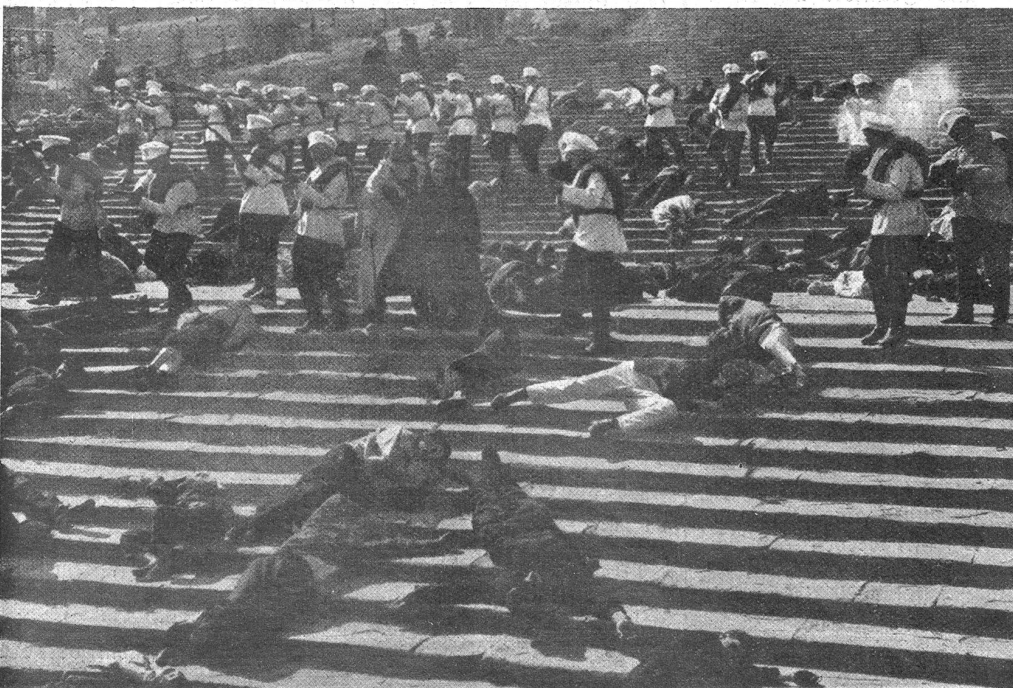
Szene aus „Panzerkreuzer Potemkin“. — Regisseur: Eisenstein.

Heute nach zehn Jahren muß wohl auch der pessimistische Zweifler bekennen, daß er damals zu schwarz gesehen hat, und daß zum mindesten für die Schweiz kein triftiger Grund mehr bestünde, dem Völkerbunde fern zu bleiben., nachdem auch Deutschland beigetreten ist und an dem ihm gebührenden Platze innerhalb der Organisation steht. Damals aber galt es zu entscheiden, ob die Schweiz dem