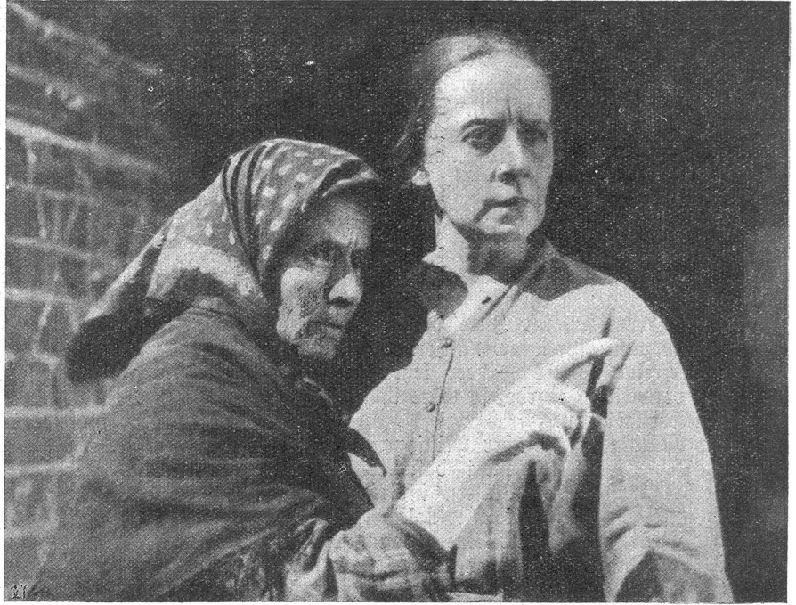
Szene aus „Die Mutter“. — Regisseur: Pudowkin.

Wir entnehmen die Angaben zu vorstehenden Ausführungen dem illustrativ wundervoll ausgestatteten von