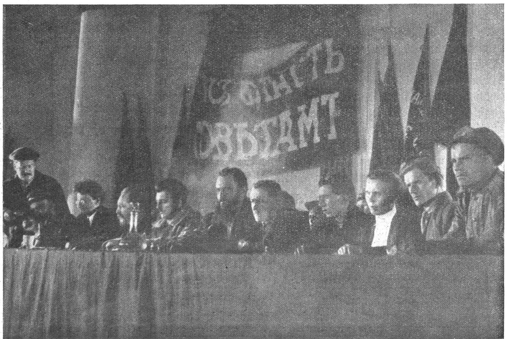
Szene aus „Zehn Tage, die die Welt erschütterten“. — Regisseur: Eisenstein.

Wie diese primitive Schwarz-Weiß-Technik paßen kann, erleben sogar wir Westlichen hemmungslos im Film „Die