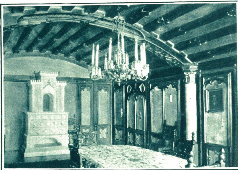
Der Ritteraal im Schloß.

Am aussichtsreichen Rorschacherberg liegt Schloß Wartensee. Urkundlich nennt 1264 als Besitzer Heinrich von Wartensee. Die Besitzer waren ein großes Rittergeschlecht, auch als sie nicht mehr vom gleichen Stamme waren, denn später nennt die Urkunde die Edlen von Diethelm-Blarer aus Konstanz als Burgbewohner. Bis 1689 blieb das Schloß im Stamme der Diethelm und später Blarer, das umfangreiche Besitztum um 12,000 Gulden an bis der Letzte zu Grabe getragen wurde. Nach nochmaligem Wechsel gelangte das Kloster St. Gallen und bei dessen Aufhebung im Jahre 1805 wurde die Burg Staatseigentum. Heutige Besitzerin ist eine polnische Fürstin, die es in Stand und Ehren hält.