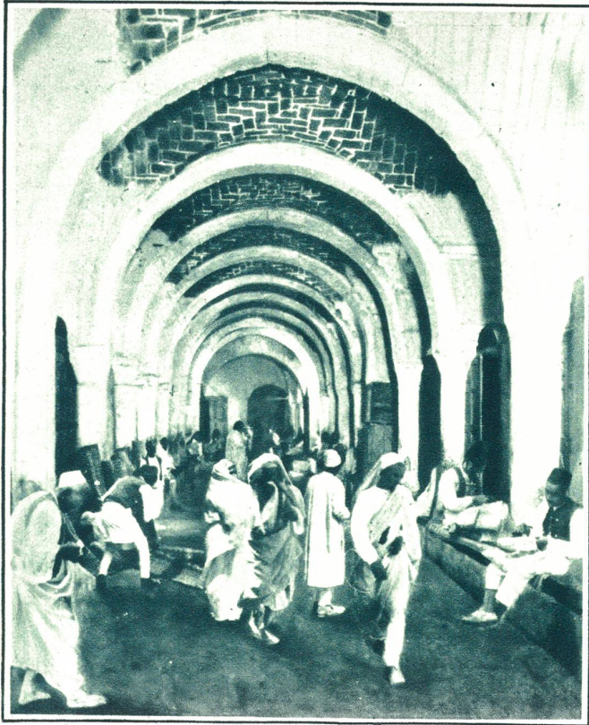
Ueberdachte Straße mit Kaufläden in Tripolis.