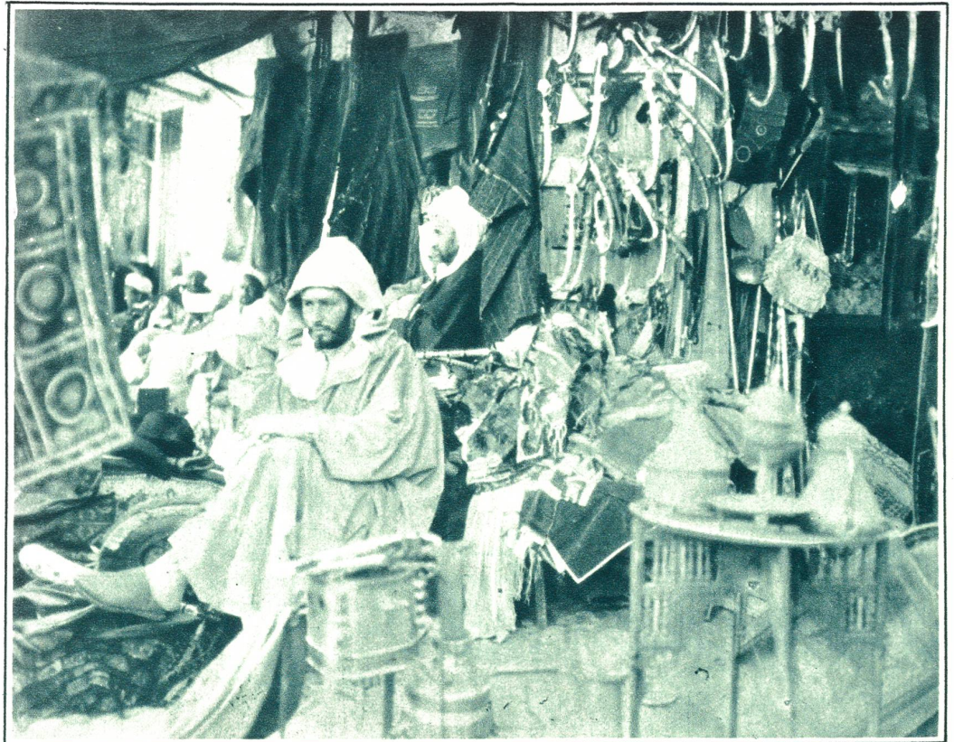
Typisch orientalischer Händler vor seinem reich dekorierten Basar, vor denen die Handwerker ihre Arbeiten herstellen.