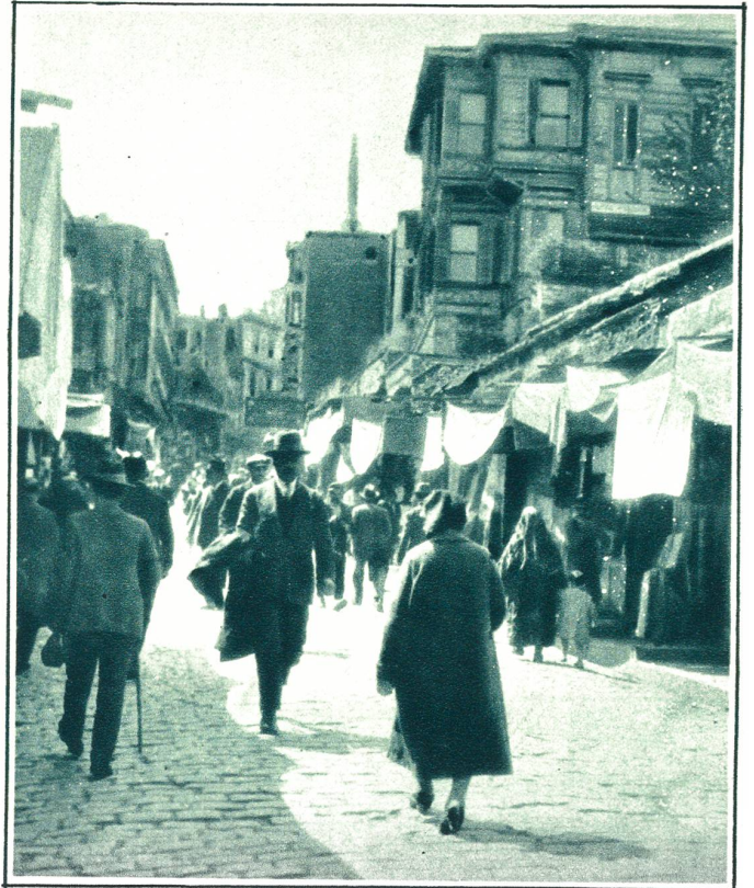
Eine der typischen Basarstraßen in Stambul (Türkei).