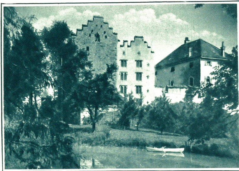
Außenansicht des Schlosses.