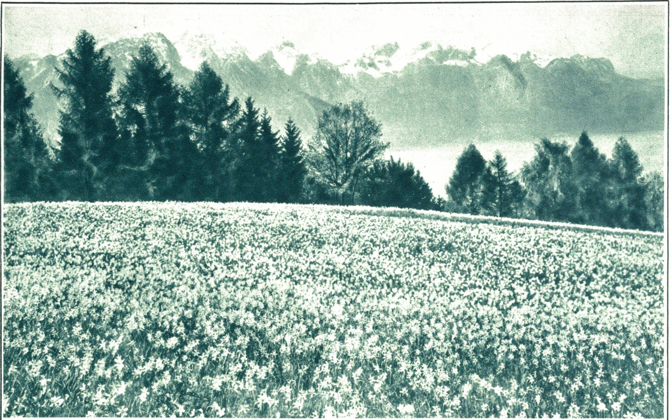
Narzissen bei Montreux mit Blick auf die Savoyer Alpen und den Genfersee, das Frühlingsziel Tausender.