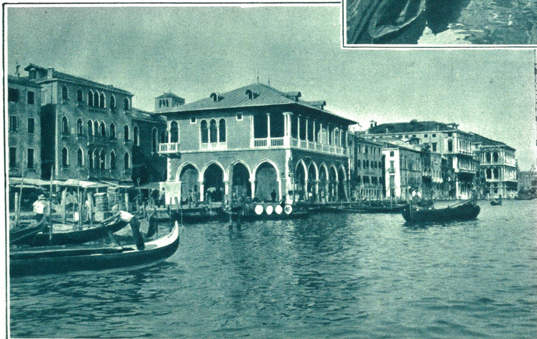
Blick vom Canal Grande gegen die Markthalle.

Konstantinopel. Um den Ausbau der Stadt bemühten sich die meisten regierenden Dogen. Wenn auch aus der ältesten Zeit der Stadt keine Bauten mehr erhalten sind, hat Venedig doch eine große Zahl prächtiger Bauten aus der Höchstblüte der Republik. Den berühmten Markusplatz mit dem 98 Meter hohen Glockenturm, der 1392 erbaut, 1902 einstürzte, jedoch genau nach altem Vorbild wieder errichtet wurde. Der 3½ Kilometer lange Canal Grande durchschneidet die Stadt mit seiner Breite von 47 Metern in zwei Teile; über ihn führt die in den Jahren 1588—1592 erbaute Ponte Rialto mit 22 Meter Breite und einem einzigen Marmor-