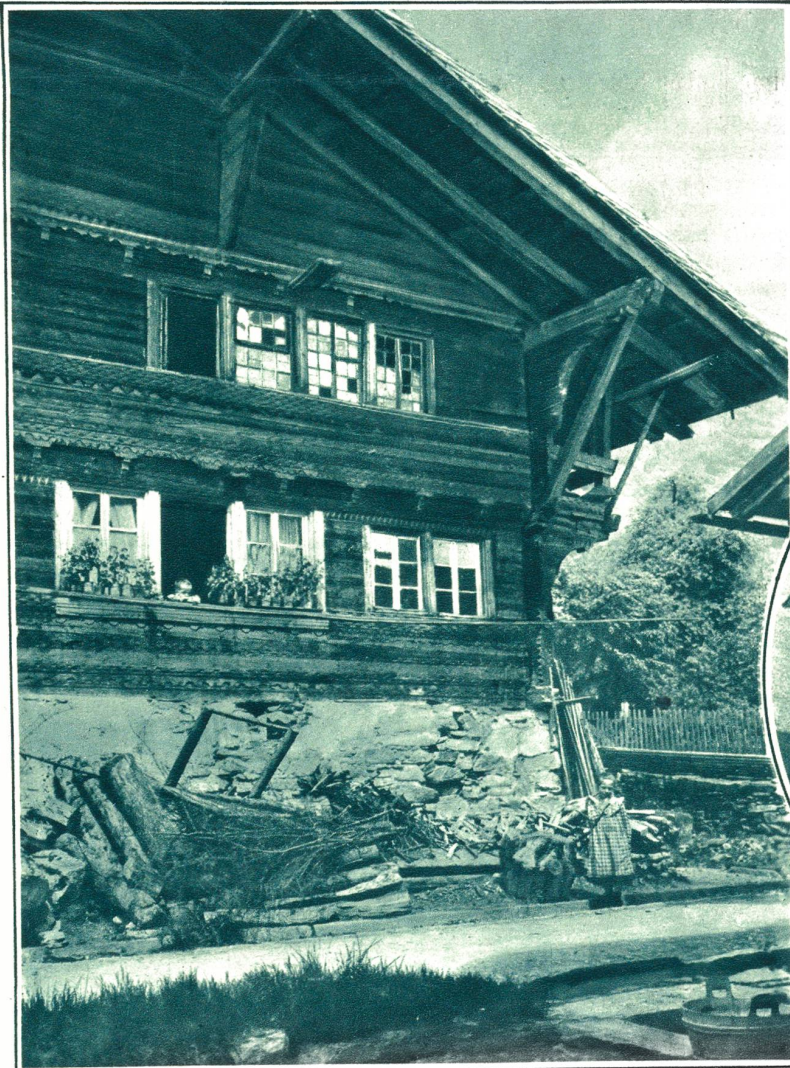
Altes Berner Oberländer-Haus am Brienzensee.

Generationen kamen und gingen und alle fühlten sich wohl in diesen von Wind und Wetter dunkelgebräunten freundlichen Häusern, die so traulich sich an die grünen Matten schmiegen oder im Schnee die Wärme des großen Kachelofens in sich behaltend, den Bewohnern Schutz und Schirm bieten. Schade, daß diese Veteranen immer mehr dem kalten Zementbau weichen müssen, der sich neben sie nistet und sie verdrängt wie der Spatz die Schwalbe.