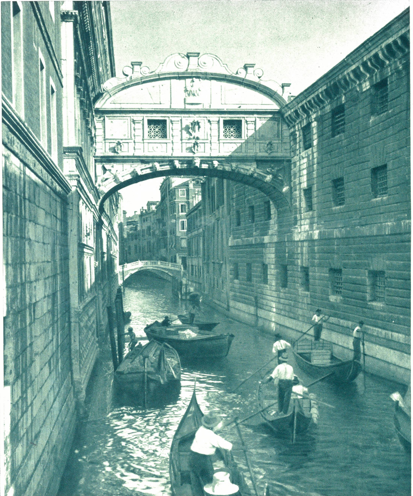
An der Seutzerbrücke in Venedig

Links der berühmte Dogenpalast, rechts das aus dem 16. Jahrhundert stammende Gefängnis, in dem furchtbare Leiden der Gefangenen warteten.