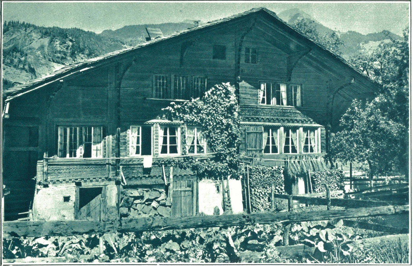
Oberländer-Haus bei Brienz.