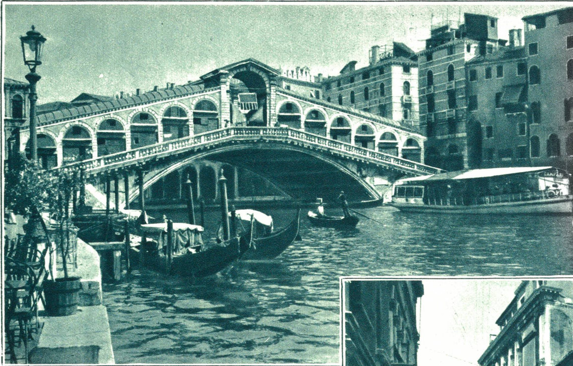
Die Rialto-Brücke über den Canal Grande.