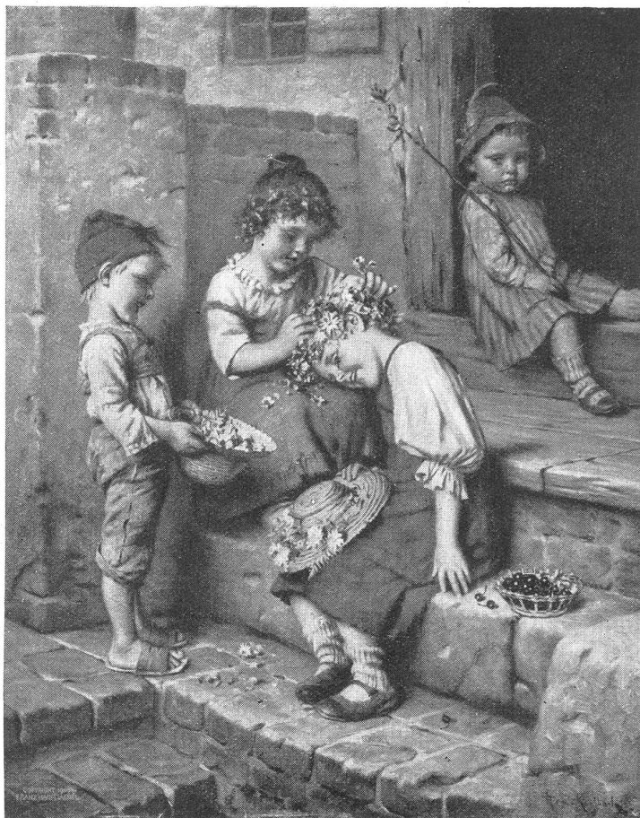
H. Kaulbach: Der Blumenkranz.

Wie macht sich, kurz gefaßt, die Blütenbefruchtung? Die in den Staubgefäßen (Staubbeutel) der Blüten lagernden sogenannten Pollenkörner (Blütenstaub) keimen, auf die Stempelnarbe der Blüte gebracht, die sogenannten Keimschläuche, diese dringen durch den Stempelstand hinab und gelangen in der sogenannten Eizelle (den Samenanlagen) zu befruchtender Entleerung. Also an und für sich ein einfacher Vorgang (und doch wieder ein wunderbares subtiles Naturspiel) und es wäre bei der Pollenmenge der Blüten kaum an ein Fehlschlagen der Befruchtung bei günstiger Witterung zu denken. Doch auch hier gibt es noch andere bedingende Faktoren für gutes Gelingen. Daß z. B. die