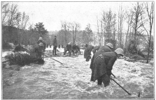
Artilleriesoldaten beim Reinigen des Fallbachbettes in der Nähe des Dorfes Blumenstein.