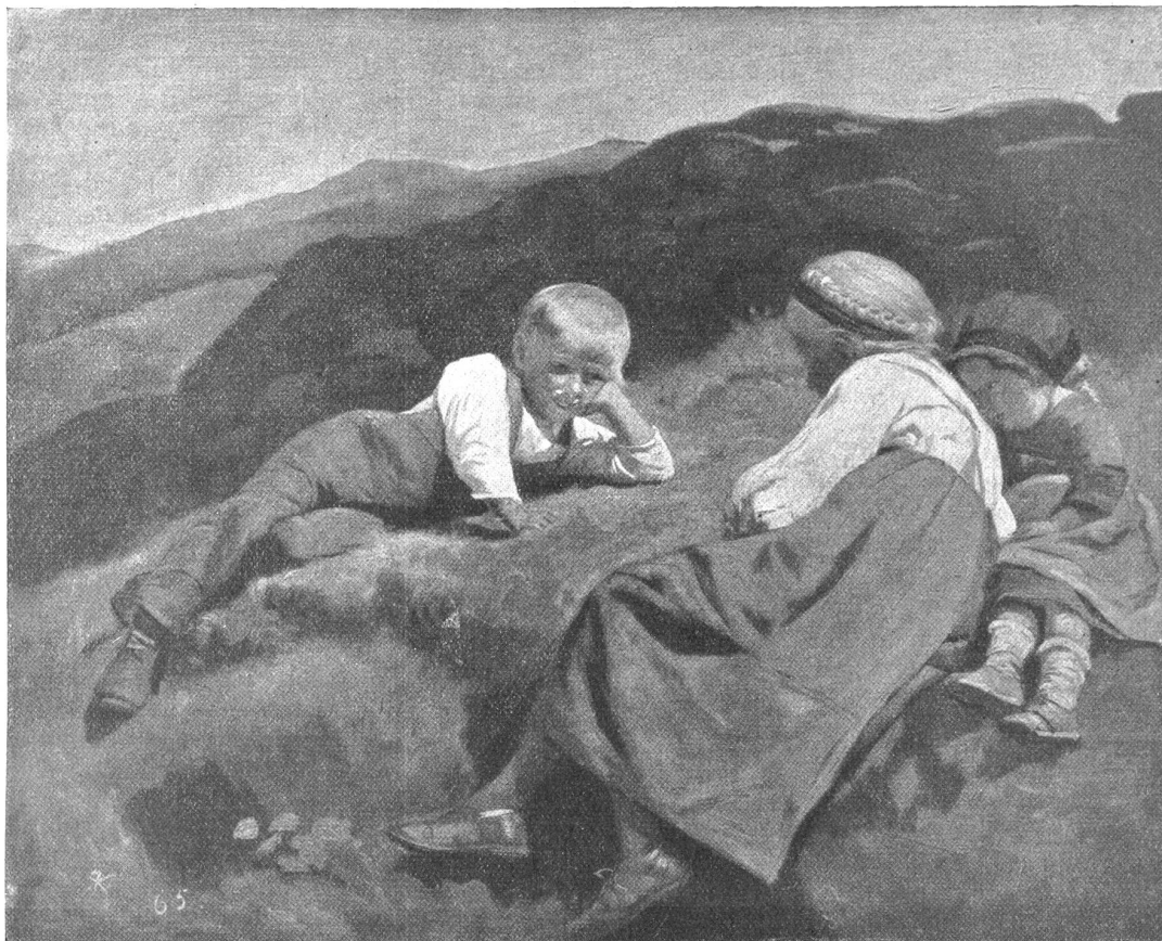
R. Koller: Kinder vom Hasliberg.

Auch in bezug auf die geistige Arbeit ist Frühaufstehen von großem Vorteil. Es ist klar, daß wir am Nachmittag