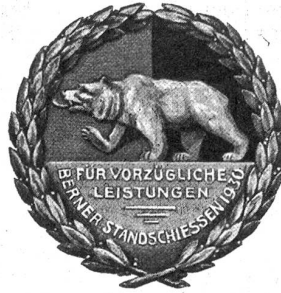
Kranzabzeichen. Lieferant: Huguenin, Le Voele.

Die Naturalprämien des Berner Standsschießens, 29. Mai bis 2. Juni 1930.