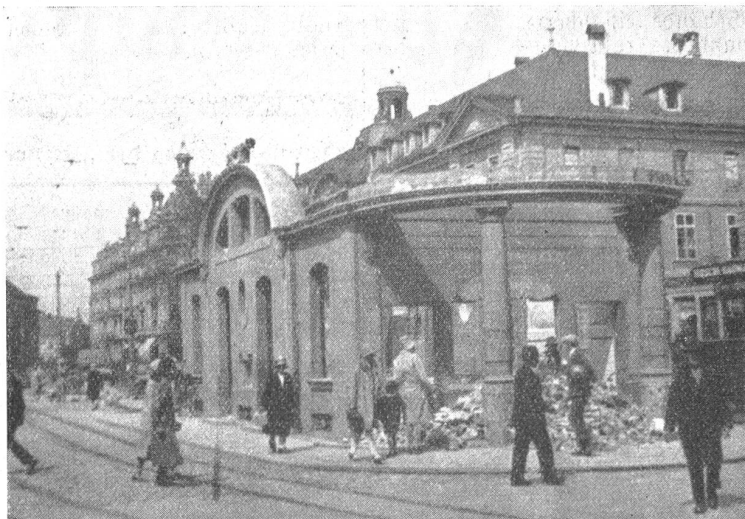
Der Abbruch des Tramhauses auf dem Bubenbergplatz.

Aber ganz genau genommen ist Bern auch heute noch keine so entsetzliche Steinwüste, daß man, wie z. B. in New York, alle paar Tage hinaus müßte, um nicht zu verstauben. Es gibt auch außer der Innern Enge noch ganz nette „Grüninseln“ als da sind Kasinogarten, Münsterplatzform, Rosengarten etc. Und sie sind auch bequemer zu erreichen als andere Wochenendorte. Und wer unbedingt am Wochenende mit der Bahn fahren will, der könnte ja auch nach Muri fah-