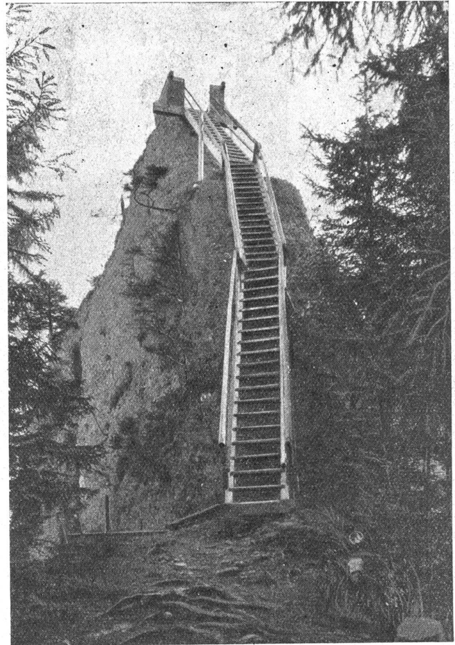
Aufstieg aufs Guggershorn (Nagelfluhfelsen).

Und weiter planen wir eine richtige Bergreise mit Gipfelbesteigungen — Ohsen und Gantrisch sollen ganz ungefährliche Herrschaften sein, ebenrecht für Kinder und