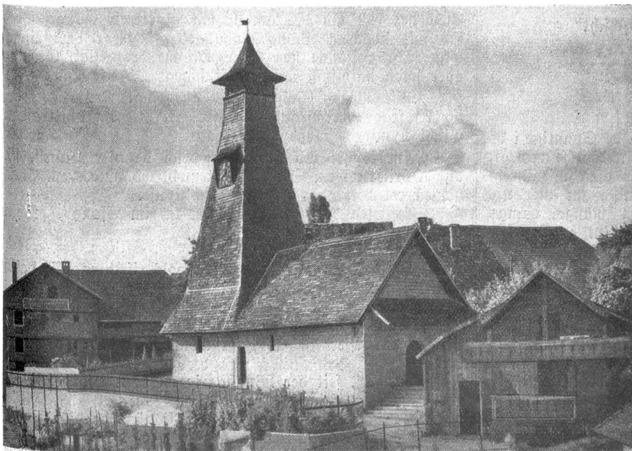
Das alte Dorfkirchlein in Schwarzenburg (1463); erneuert 1913.

Mein Freund war bei seinem Bläneschmieden recht warm geworden. Und eben wollte er noch eine Variante der Auto-Rundfahrt, die über Seitenried, Freiburg, Rechthalten, Plaffeien und Schwefelberg führen sollte, vor meinen aufmerksamen Ohren entwickeln, als zum Tee gerufen wurde, der auf der heimeligen Laube gedeckt worden war. Die Frauen wollten nun wissen, was für ein Thema uns so lebhaft beschäftigt habe. Unsere freundliche Wirtin bestätigte mit Ueberzeugung das Lob, das ihr Mann dem Schwarzenburger Ländchen gesungen, und fügte bei, daß es zu ihren angenehmsten Erlebnissen gehöre, in den sauberen Läden des Dorfes Einkäufe zu machen und mit den Leuten zu plaudern. „Ich vernehme dabei so viel Interessantes aus dem Leben dieser Men-