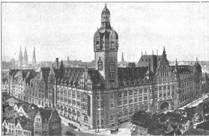
Bremen. — Lloydgebäude.

In jedem Menschen besteht das Bedürfnis nach Zärtlichkeit — das heißt nach Körpernähe und Körperwärme einer zweiten Person — als Erinnerungsrest aus der Zeit vor der Geburt und des Säuglingsstadiums, wo Stillung des Nahrungsbedürfnisses und Luftbefriedigung noch in eins zusammenfielen. In einer spätern Periode (ungefähr vom 1. Lebensjahr an) gesellt sich diesem Bedürfnis auch der Wunsch nach Beachtung, der vorerst keine andern, als die körperlichen Ausdrucksmittel kennt. Er äußert sich, je nach Anlage, aktiv oder passiv, ist aber auch dort, wo es scheinbar fehlt, im Keim vorgebildet und latent fast immer vorhanden. Am stärksten wirkt es sich im Kindesalter aus — analog dazu lassen sich auch junge Tiere gerne streicheln und hätscheln, was ihrem instinktiven Wärmeverlangen entgegenkommt —; wird während und nach der Pubertät durch erotische Wünsche abgelöst und ersetzt, stumpft sich im spätern Leben mehr oder weniger ab und erfährt erst wieder im Alter eine gewisse Reaktivität, allerdings mit sehr geringer Aussicht auf Befriedigung.