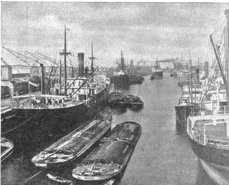
Bremen. — Sreihafen.

Wie sie selbst ihren Bewohnern durch die freundlichen gärtnerischen Anlagen des Walls, der als Ueberrest der alten Stadtbefestigung wie ein grüner Gürtel den ältesten Stadtteil umschließt, oder durch den prachtvollen Bürgerpark Erholung und Erquickung gewährt, so mag sie auch mit den wechselvollen Bildern ihrer Gegensätzlichkeit immer wieder neu und anziehend auf den Fremden wirken. Reich an wertvollen Sammlungen sind die Museen; kostbar die Kunstgegenstände, die die Stadt ihr eigen nennt. Beachtlich und anerkannt ist die bremische Bühnenkunst und erfreulich vielseitig und genussreich das Musikleben der Handelsmetropole. Auch Spiel und Sport finden in den Mauern dieser Stadt ihre Pflegestätte. Ein hochmodernes Stadion auf dem Peterswerder steht für diesen Zweck zur Verfügung. Ein an Bedeutung zunehmender Flughafen bietet die Voraussetzungen für eine wirkungsvolle Förderung des jüngsten aller Verkehrsmittel: der Fliegerei! Und wer in der Absicht der Stadt am Weserstrom entgegenreist, um auf der Fahrt durch die niederdeutsche Tiefebene die herbe Schönheit von Heide und Moor zu genießen, der findet in ihrer nächsten Umgebung die Eigenart dieser Landschaft