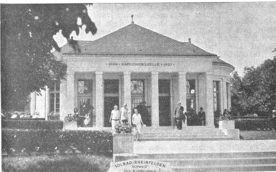
Die Trinkhalle mit dem Kapuziner- und dem Magdalenenbrunnen.