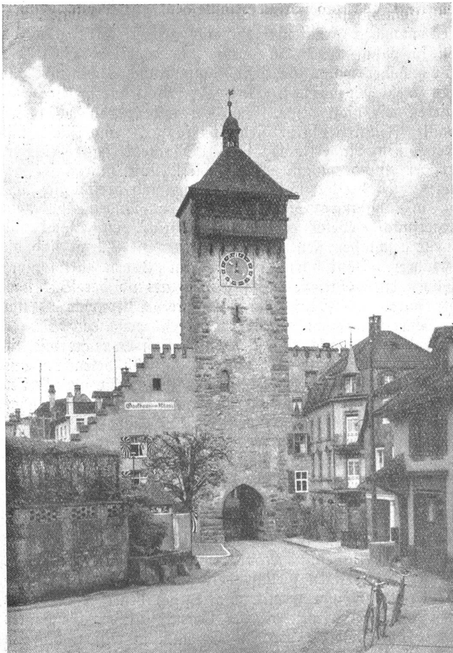
Rheinfelden. Der Obertorturm.

Drei Kirchen sind Zeugen eines religiösen Lebens mit bewegter Vergangenheit. Die Stadtkirche oder Martinskirche ist ein Prachtsbau, im Innern im stilvollsten Barock ausgestaltet. Sie wurde 1874 den Altkatholiken zugesprochen. Die protestantische und die römischkatholische Kirche nehmen sich neben ihr nur bescheiden aus. (Schluß folgt.)