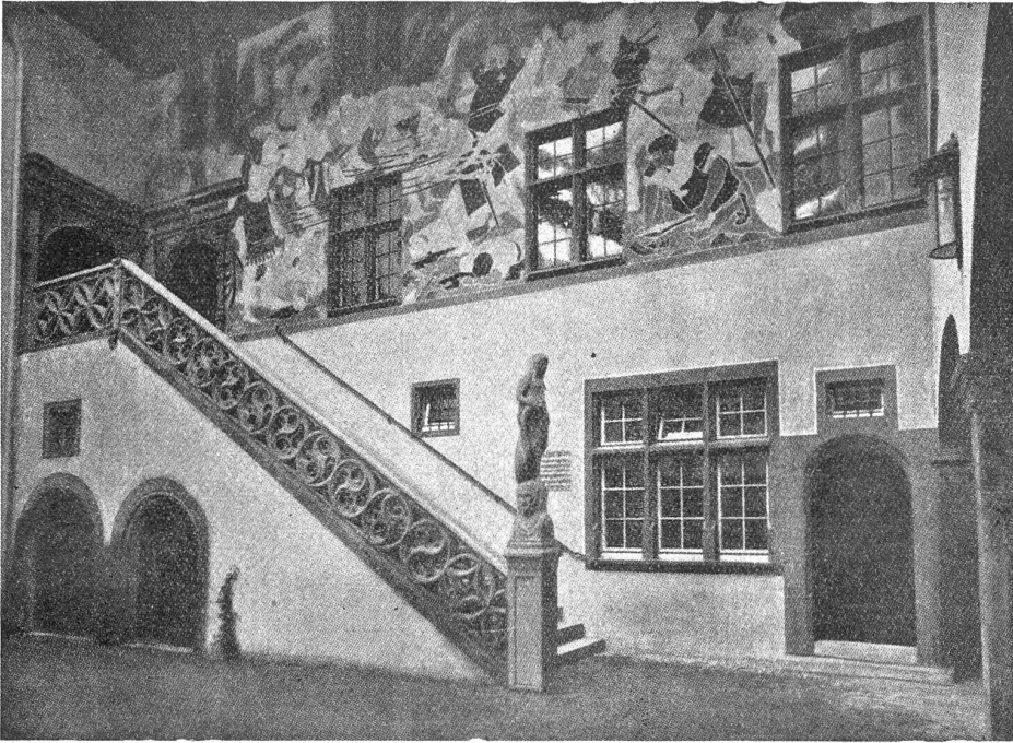
Rheinfelden. Treppenaufgang im Hof des Rathhauses mit Sreskobildern von Paul Altheer.

sie aus der Fremde eher zu ihm zurückkehren würde als aus der gegenwärtigen Umgebung, wo sie noch Freunde und Verwandte hatte, vermutete ich eine Frau dahinter.