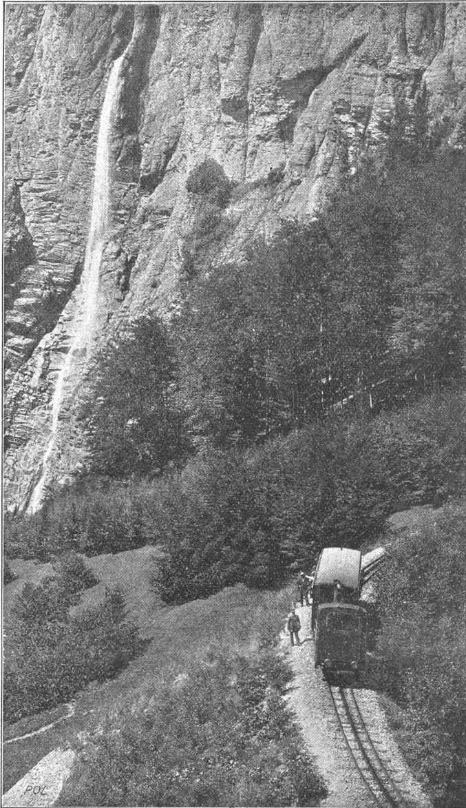
Die Briener Rothornbahnlinie beim Mühlebadfall.

samkeit gebracht, das Gewitter, dessen Loben man über dem Frutigertal verfolgen kann, verschonte das unwettergewohnte Haus, und eine muntere Schar Touristen sorgt für den Betrieb. So kramt er aus einem Schatz der Erinnerungen an die fast 25 Jahre, die er als Bahnmeister zwischen See und Gipfel verbracht. Trauriges weiß er zu berichten: von Abstürzen leichtsinniger Touristen, von Einbruchsdiebstählen im Hotel und von jener unbegreiflichen Brandstiftung, die 1885 den für 65 Gäste eingerichteten Gasthof einäscherte. Gerettet wurde einzig das 1865 begonnene Fremdenbuch, der beredte Zeuge begeisterter Wanderer. Neben den Namen vieler Unbekannter leuchtet die Unterschrift des berühmten Arztes Es-march und der Namenszug eines deutschen Fürsten hervor. Und auch der Zeichenlehrer aus Brienz schrieb in den 60er Jahren seinen Eintrag ins Buch; er konnte nicht ahnen, daß mehr als ein Halbjahrhundert später sein Sohn einer der begeistertsten Ränder der einzigartigen Schönheit dieses Berges mit seiner grandiosen Rundschau würde: Heinrich Federer.