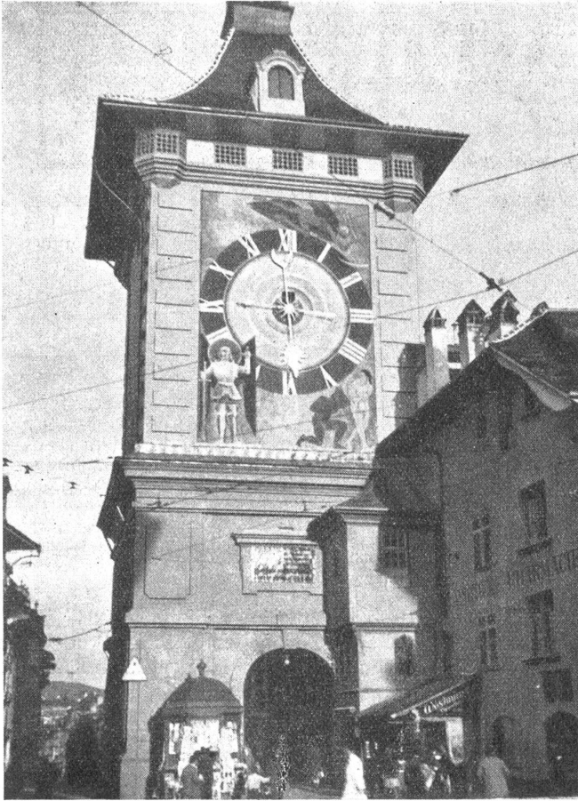
Der neurenovierte „Zytglogge“ in Bern. Ansiht stadtaufwärts mit den Malereien von Viktor Surbek.

Das Uhr- und Spielwerk scheint seit jeher so funktioniert zu haben wie heute, denn in einer „Beschreibung der Stadt und Republik Bern“, die ohne Nennung des Verfassers im Jahre 1794 „bei der Typographischen Societät neben dem Hotel“ herausgegeben wurde, wird der Turm folgendermaßen beschrieben: „Der Zeitglockenthurm in der Mitte der Stadt hat diesen Namen, weil darinn die Hauptuhr der Stadt ist. Berchtold von Zähringen steht geharnischt in kolossalischer Größe auf diesem Glockenthurm, und schlägt die Stunden an die Glocke. Dieser Thurm war damals das Stadthor, obchon er iht nicht mehr die Breite der Hauptstraße einnimmt. Unter der großen Uhr ist noch eine andere, deren Zeiger alle 24 Stunden einmal umgeht, und die zugleich Kalenderuhr ist. So oft es schlägt, läuft eine Schaar kleiner Bären in einem Kreis herum; ein Hahn krähet alle Stunden drey mal vor- und einmal nachdem es die Stunde geschlagen; ein sitzender Mann mit einem Stab in der einten Hand, in der andern eine Sanduhr haltend, schlägt und zählet mit Aufthun des Mundes und Schlagen des Stabs alle Streiche, soviel die Uhr schlägt. Ein anderes hölzernes Männchen läutet, wenn die Stunde schlagen will, zwey kleine Glöcklein.“ Diese Beschreibung stimmt ja auch noch heute.