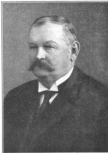
† Carl Vogt.

In einer kleinen, ostschweizerischen Karton- und Papierfabrik hatte er sich gründliche Fachkenntnisse angeeignet und brachte es bis zu leitender Stellung. Nach dem Ableben des