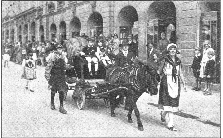
Die Kinder Seiler im Festzug der Mezgergaf-Chilbi.

Schöthalde, mit dem Stadtbanner in der Faust, von den Mannen des Habsburgers im ritterlichen Kampfe erschlagen wurde, von der Rathausstreppe aus in der Samstag-Sonntagnacht vergnügliche Zwiesprache gehalten. Und er erzählte mir so manches von verschiedenen Festvitäten, die er mitmachte, als er noch in der Gerechtigkeitsgasse stand, denn seinerzeit fetete die ganze untere Stadt gemeinsam. Nur — so meinte er — damals seien die Leute noch nicht so zahm gewesen wie heute. Damals mußte die Scharwache immer einschreiten, während diesmal die Polizei die ganze zweitägige Chilbi lang, keine einzige Gelegenheit hatte, ihre Latzkraft zu beweisen. Leider ließ ich mich darauf verleiten, ihm ein Privatissimum über unsere heutige Zivilisation und psychanalytische Selbstbeherrschung zu halten, die die Polizei eigentlich ganz überflüssig machten. Da aber machte er plötzlich ein „steinernes“ Gesicht und tat, als ob er mir gar nicht mehr zuhörte. Und so trollte denn auch ich, auf meinen höchst eigenem Beinen, da ja doch kein Tram mehr fuhr, betrübt heimwärts.