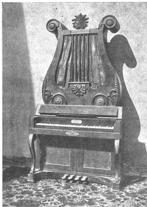
Das prämierte Pianoforte aus dem Jahre 1830.