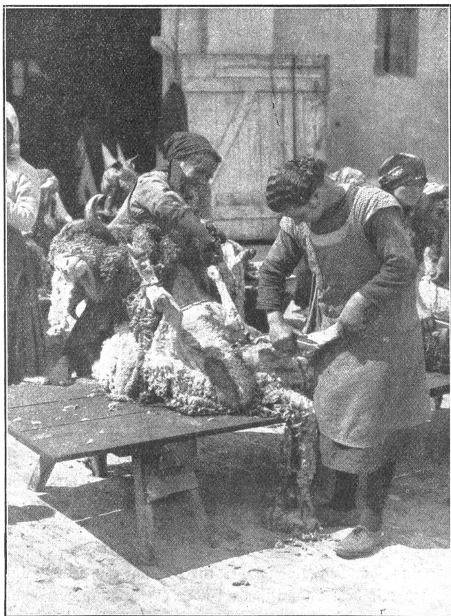
Schaffschur in Mezöhegyes in der Gegend von Szolnok (Ungarn).

Ihr nach Mekka gerichtetes Antlitz schaut weit ins Abendland herüber, obschon ihre Augen geschlossen sind. In ruhigem Vertrauen auf die Vollbringung und den In-