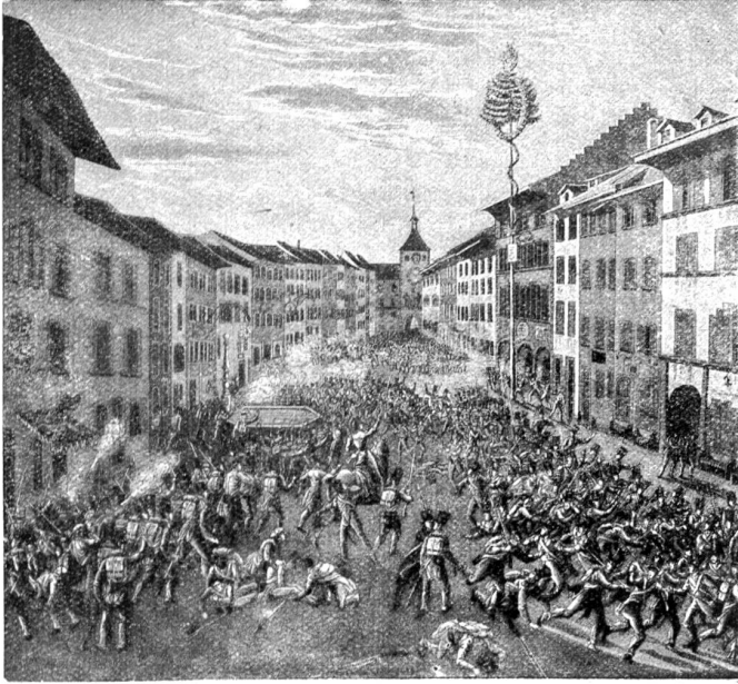
Kampf in Liestal am 21. August 1831.

die eine Trennungsmehrheit aufwies, vorläufig vom 15. März an die staatliche Verwaltung zu entziehen. Man hoffte in der Stadt, die Landgemeinden würden bald als Bittende nahen und Wiederaufnahme in den Staatsverband anbegehren. Man täuschte sich. Am 17. März 1832 legten die Führer der Landschaft in Liestal den Grund zu einem souveränen Staatswesen „Basel-Landschaft“. Sofort wurde ein Verfassungsentwurf aufgestellt, dieser am 14. Mai 1832 angenommen.