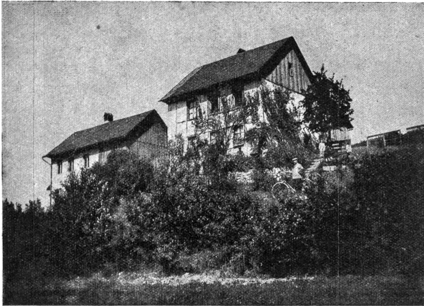
Hier kam ich auf die Welt. (Aus „Grock, Ich lebe gern.“)

und anmutig zeremoniösen Weise, die sie vorhin bei anderen belächelt hatten.