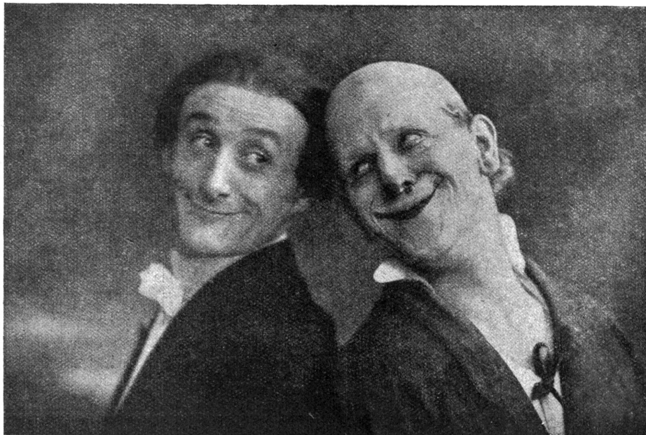
In Petersburg. (Aus „Grock, Ich lebe gern.“)

„Erstes Klingelzeichen! Ich werde mich hinauf zur Bühne begeben müssen, es ist Zeit. Wie oft ich schon auf der Bühne stand? Ich habe es mir neulich ausgerechnet: Ungefähr zehntausendmal. Aber das zehntausendste Mal ist