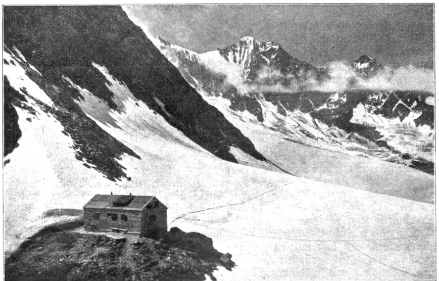
Saas Fee: Brithanniahütte, Dom und Nidlenz.