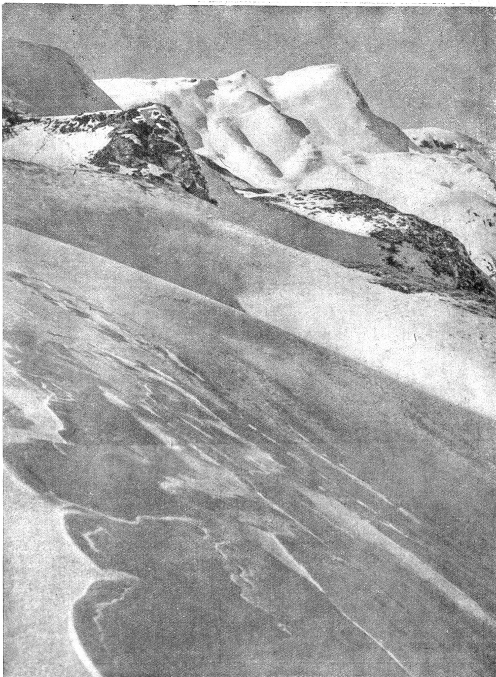
W. Gadby. Windverwehter Schnee.

Die beiden Brüder Superjago — Söhne eines berühmten Führervaters, der noch mit 70 Jahren den Gang, den wir vorhaben, bezwang! — sollen einst einem etwas hoffnungslosen Deutschen mit fröhlichen Fodlern über die teuflisch späßigen Felsgendarmen auf dem Nadeljoch hinüber geholfen haben, gut! daß es so ist: ein wägender Blick über meine