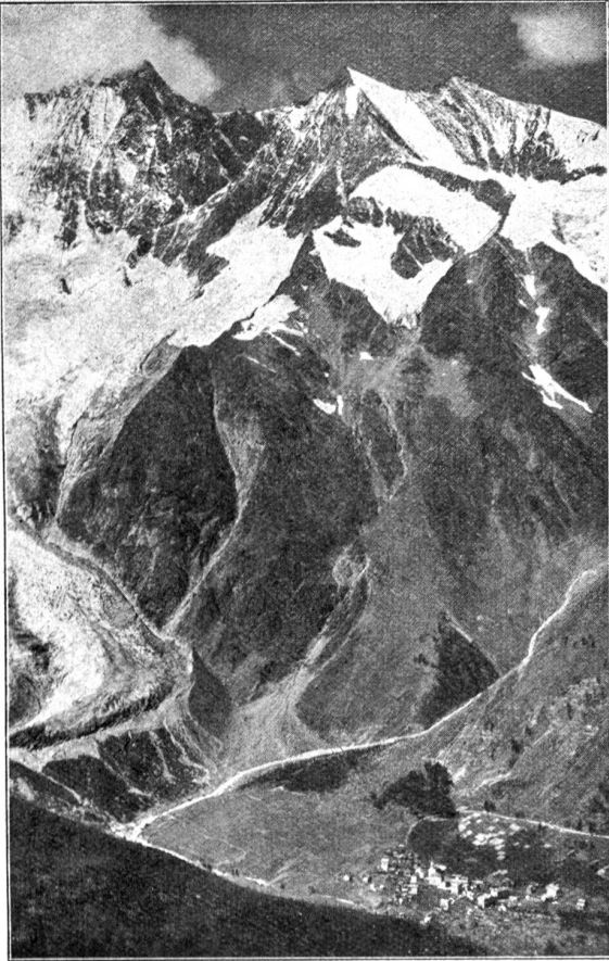
Saas Fee mit Dom, Südlern, Nadelhorn.

kein Gode nehmen? doch, da überbordert der Gletscher, bist! halt Gletscher! noch ein wenig, bitte — schon sind wir um die Ecke und steigen und klettern halb im hübschen Weglein, das durch den nackten Fels hinaufreicht. So — ein wenig sinn'eren, eine Kehre nicht nehmen, das eine Pein, hopppla, schwebt vorn über dem Fels in der Luft. — Müstig weiter und in 2 3/4 Stunden haben wir den Weg zur Hütte geschafft, stoßen die Türe auf — pardon, sonst dürst ihr also, wenn ihr hinaufgeht, vier gute, rüstige Stunden ruhig rechnen — wir haben bloß etwas lange Beine gemacht — da grüßt uns ja schon der Saas-Feer Hüttenwart, lacht, Gesellschaft hat er sicherlich gerne, wir werfen die Sachen ab, die — mich — drücken. Und bald dampft auch schon die Suppe auf dem Tische. Der Tee folgt gleich nach. Die Engländerinnen folgen auch nach, Oberkellner spie'e ich sehr gerne, aber englisch kann ich leider! nicht. — Und sie nicht deutsch. Und ich wieder nicht gut Saas-Feerisch spreche und der französische Führer mangelhaft deutsch radebricht, das ist eine Gesellschaft, der es an Unterhaltungsstoff verschiedenster Art sicherlich nicht mehr gebriecht.