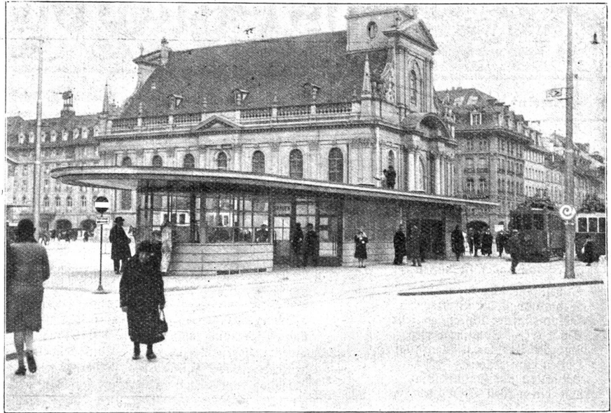
Das neue Tramstationsgebäude und der Bubenberglplatz.

werden, der Kiosk ist heute direkt ein Bedürfnis, und daß die Trambeamten in ihrem Glaszimmer gut plaziert sind, zu Gunsten einer raschen und sicheren Tramführung, ist nur zu begrüßen.