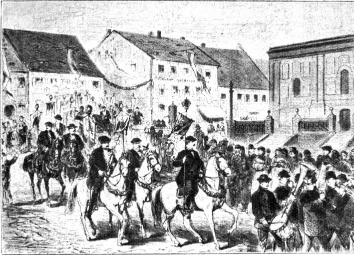
Osterreiter in Tetschen (Böhmen).

Nach einer Zeichnung von W. Grögler. — Die Sitte geht auf die altheidnische, wilde Jagd zurück. Die Dreizahl der Schimmelreiter bezieht sich auf die Göttertrilogie. An die Stelle der Lanzen traten Fahnen.