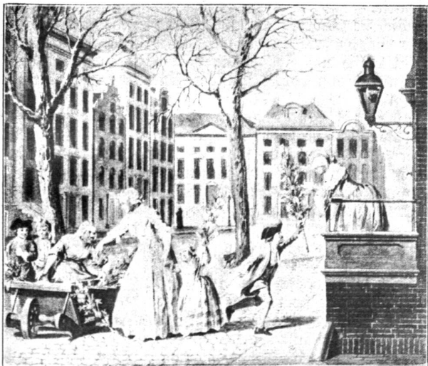
Osterbräuche in Holland.

Moltke hat einmal gesagt, daß das einzige Stück Wirklichkeit, das von der Geschichte übrig bleibt, der Ort ist, auf dem sich die Dinge einst abspielten. Dieses Gefühl, daß