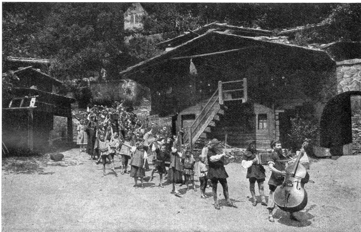
Die Tellspele in Interlaken. — Der Hochzeitszug.

Die Tellaufführungen sind nicht nur eine private Gelegenheit einiger Kunstbegeisteter, sondern ganz Interlaken macht diesmal wiederum wie schon das erstemal mit. Die 350 am Spiele Beteiligten, die Frauen und Männer, Jünglinge und Kinder, sind Bewohner Interlakens und der Nachbarorte. Sie alle wissen, daß sie nicht um des eigenen Ruhmes willen, sondern für eine schöne Gemeinsamkeitsache sich anstrengen und ihre Zeit hingeben. Gilt es doch, den alten Ruhm Interlakens als Metropole des Oberlandes, als schweizerisches Zentrum des Fremdenverkehrs aufzufrischen und zu mehren.