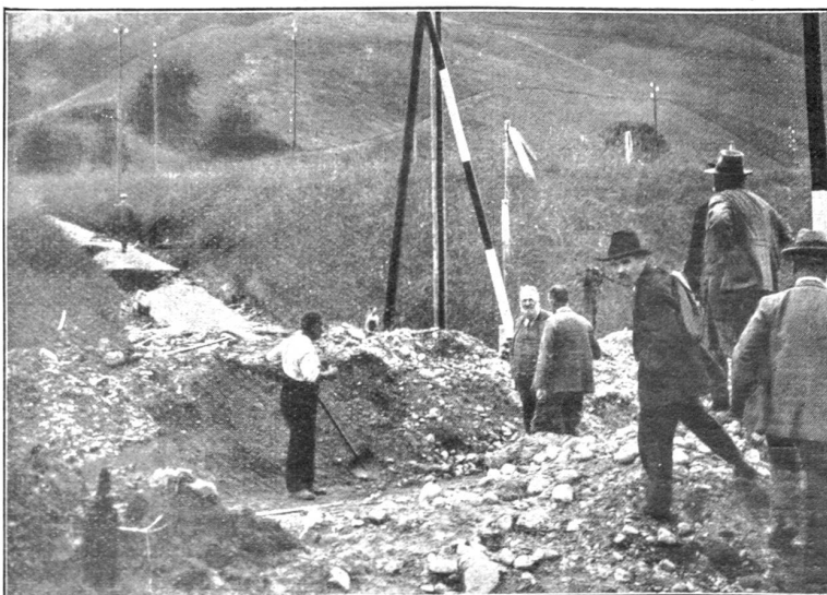
Die verschüttete Burgdorf-Thun-Bahn am Ausgang des Hosbachgrabens.

Aber wiederum durfte man erfahren, wie groß bei uns die freundnachbarliche Hilfe ist. V.