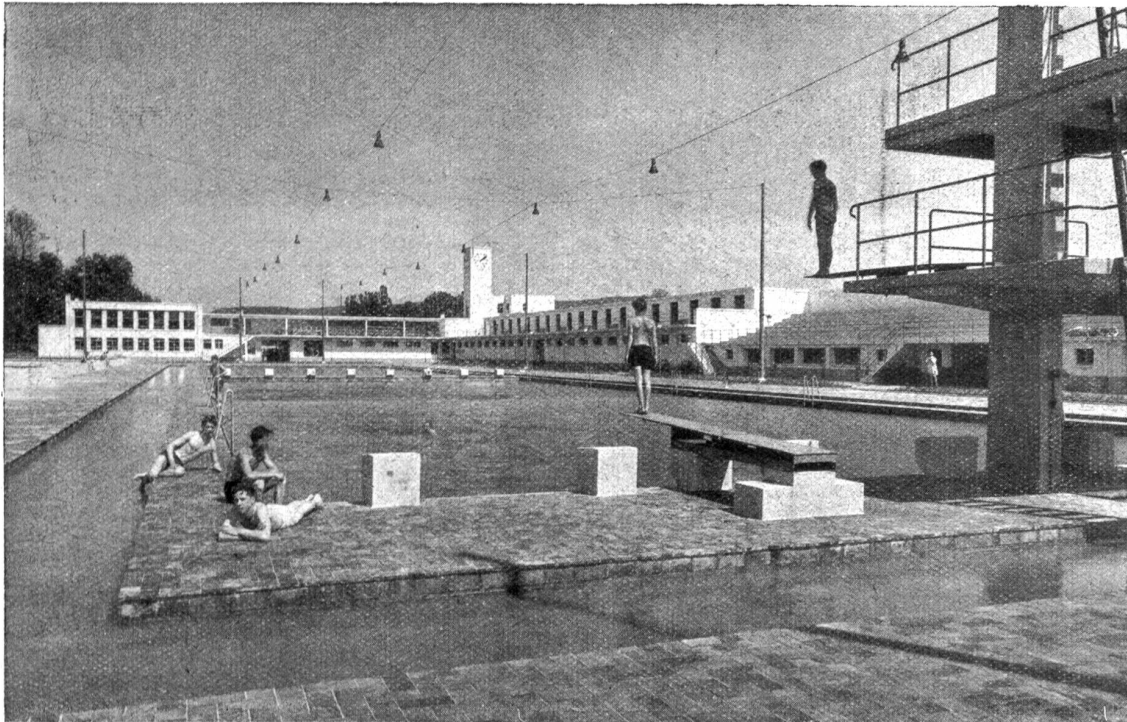
Das Basler Gartenbad Eglisee. — Gesamtbild des Familienbades gegen Wirtschafts- und Dienstgebäude.

die Zeit nahm und wie sie es anstellte, für Mann und Geschäft zu sorgen und dabei immer so appetitlich sauber zu sein.