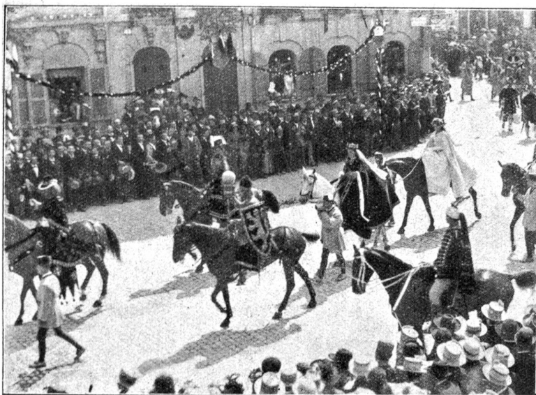
Historischer Festzug an der Gründungsfeier der Stadt Bern 1891.