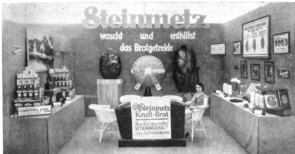
Aus der Gruppe Nahrungsmittel der „Hyspa“. — Steinmetzbrot.

schäumenden Frische, trinken wir sie ohne Kaffeezusatz, mit einem leichten Zusatz, oder am Ende bloß als zimperlische Beigabe in eine Herzklopperkaffeebrühe hinein? Es soll Bauern geben, die ihre Milch lieber in der Käseerei zu Geld machen, als daß sie gesunde Kinder haben wollen. Das unterernährte Bauernkind ist keine Ausnahme.