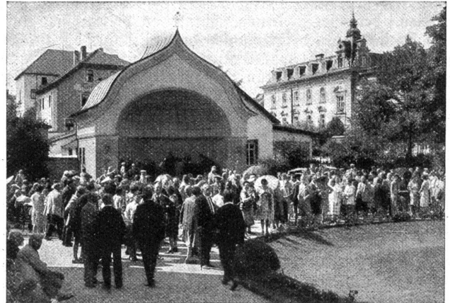
Bad Wörishofen. — Musikpavillon.

gegenseitiger Abschachtung, aufzurichten. Darum darf die gesundheitliche Volksaufklärung nie sich genügen, nie erlahmen. Ein Buch wie das vorliegende, das das von Kneipp