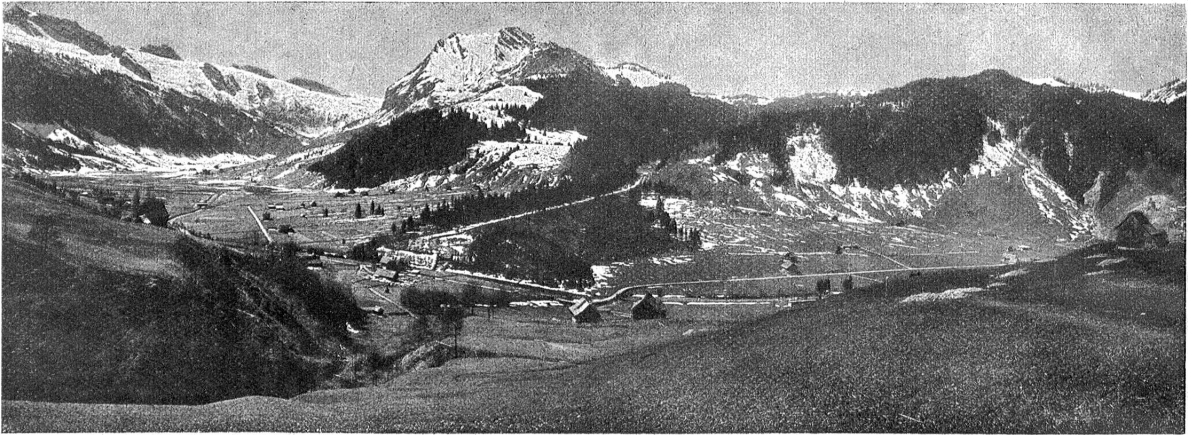
Der Calboden Innertal vor dem Einstau, aus Südoften gesehen.