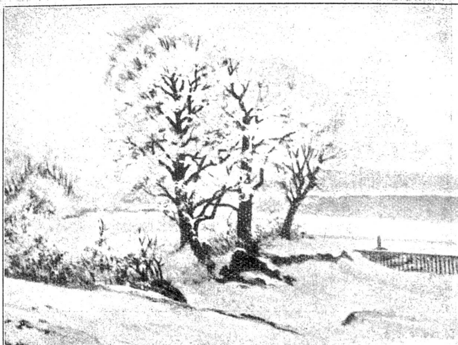
Winter in der Elfenau.

Mitten in eine bedenkliche Schweige hinein lachte er los, auf eine so wirtschausmäßige Art, daß ihn beide Frauen fragend ansahen; und darüber ritt ihn der Teufel: Ich dachte nur, wie sonderbar dies sein mußte, wenn sich zwei Löwen ihren Wärter gezähmt hätten, sagte er so dreist wie möglich, und daß er selber die Ungezogenheit fühlte, machte sein Gesicht nicht angenehmer, als er wieder einmal zu hauen und stechen bereit breitbeinig da stand.