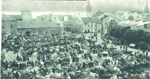
Der Markt im Städtchen Memel, dessen deutscher Landespräsident von der litauischen Regierung abgesetzt und verhaftet wurde, welcher „Staatsstreich“ von den Deutschen vor den Völkerbundsrat gebracht wurde und von diesem gern auf den Gerichtshof in Haag abgewälzt würde, weil sich die Völkerbundsratsherren schon mit dem chinesisch-japan. Konflikt nicht zurechtfinden.