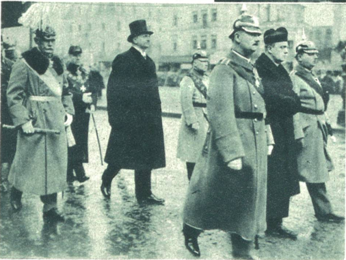
Die Besetzung des verstorbenen früheren Königs von Sachsen erfolgte mit militärischen Ehren in der Hofkirche zu Dresden.

Das Rechtsministerium Laval wurde vom Senat gestürzt, damit es einem Koalitionskabinet Platz mache. Painlevé hat kein solches zustande gebracht. Nun hat Tardieu an Stelle des Ministeriums Laval - Tardieu ein solches Tardieu-Laval gesetzt. Das neue Ganzrechtsministerium soll nun wenigstens noch den kurzen Rest der Wahlperiode „halten“.