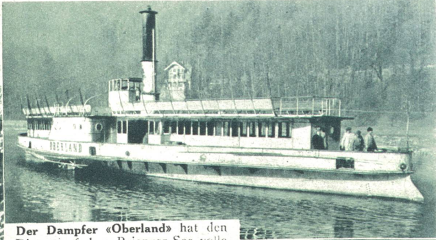
Der Dampfer «Oberland» hat den Dienst auf dem Brienzer-See volle 60 Jahre versehen und wurde letz- thin auf Abbruch verkauft.