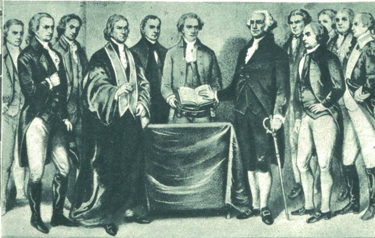
Die Veredlung George Washingtons als erster Präsident der Vereinigten Staaten von Nordamerika. Am 22. Februar 1932 wurden in ganz Amerika große Feiern zu Ehren des 200. Geburtstages des amerikanischen Nationalhelden George Washington veranstaltet. Washington war Oberbefehlshaber im Freiheitskrieg der amerikanischen Kolonien gegen England und wurde im Jahre 1789 der erste Präsident der Vereinigten Staaten. Unser Bild zeigt Washington (mit dem Degen), neben ihm (rechts) John Adams, späterer Präsident der U. S. A.

verläßt nach einer Augenoperation (Star) die Klinik. Mit Rücksicht auf die gespannte internationale Lage hat Macdonald auf den geplanten Erholungsurlaub im Ausland verzichtet.