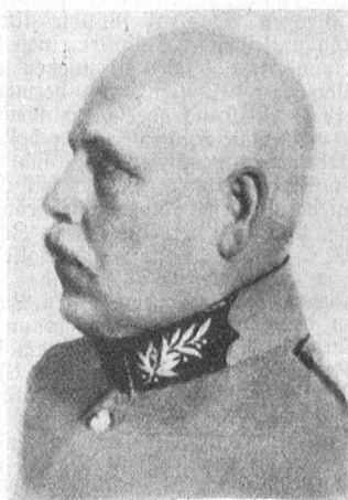
† Oberstkorpskommandant Heinrich Scheibli, Kommandant des 2. Armeekorps.

Im Alter von 64 Jahren verstarb am 19. Mai in Degersheim, wo er zur Kur weilte, Oberstkorpskommandant Heinrich Scheibli ganz plötzlich an einem