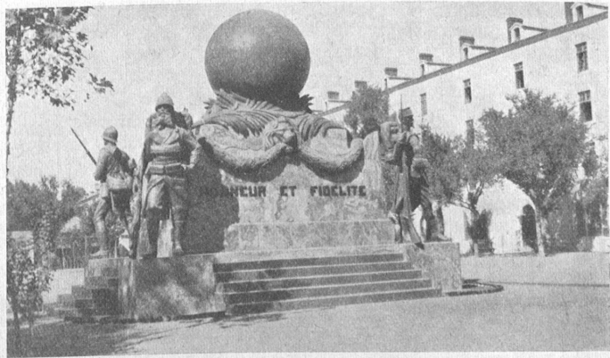
Das Denkmal der Fremdenlegion in Sidi-Bel-Abès.

Auf der das Denkmal krönenden Weltkugel sind die Taten der Legionäre auf vier Weltteilen verzeichnet.