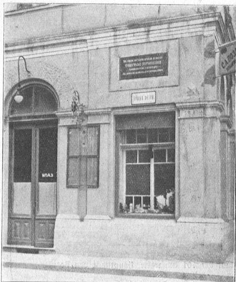
Haus mit der Gedenktafel für Gavrilo Princip, den serbischen Studenten, der am 28. Juni 1914 das verhängnisvolle Attentat auf das österreichische Chronfolger-Paar ausführte.

Warenballen und — warten auf den Käufer. Kein lästiges Unladen, kein überchwengliches Anpreisen, kein lautes Rufen