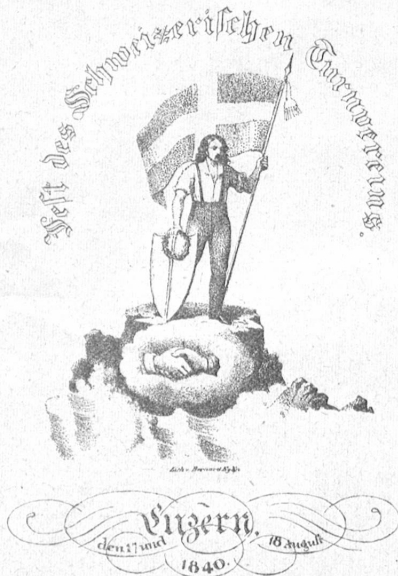
Vorderseite der Festkarte des Schweizerischen Turnfestes 1840 in Luzern.

Turnfest seine Abhaltung. Es sah recht bescheiden aus. Zu den 32 Zürchern gesellten sich 28 Berner, Luzerner, Basler, Aarauer und Badener, so daß im ganzen 60 Mann