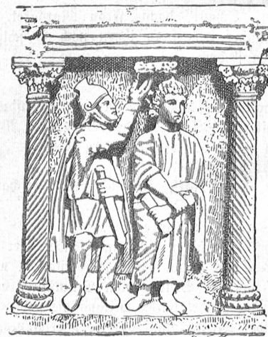
Abb. 2. Angebliche „Dornenkrönung“-Sarkophag im Lateran. Galt früher als die älteste Christusbildung.

Es kann dabei nicht auffallend sein, wenn sich die Bibel selbst über das körperliche Aussehen Christi ausschweigt,