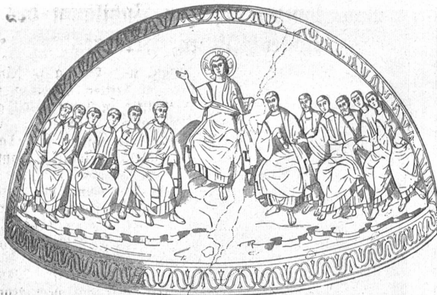
Abb. 3. Christus und die Jünger, Mosaik in S. Aquilino in Mailand. Jugendlicher Christustyp.

mischen Kunstkreis geschaffene Christusdarstellung wäre die der „Dornenkrönung“ auf einem frühchristlichen Sarkophage im Lateranmuseum zu verstehen, wenn — die Bezeichnung „Dornenkrönung“ für das Werk zu recht besteht und es sich nicht um einen heidnischen, erst später christlicher Bestattung zu Diensten gemachten Sarkophag handelt, was wahrscheinlicher sein dürfte. (Abb. 2.)