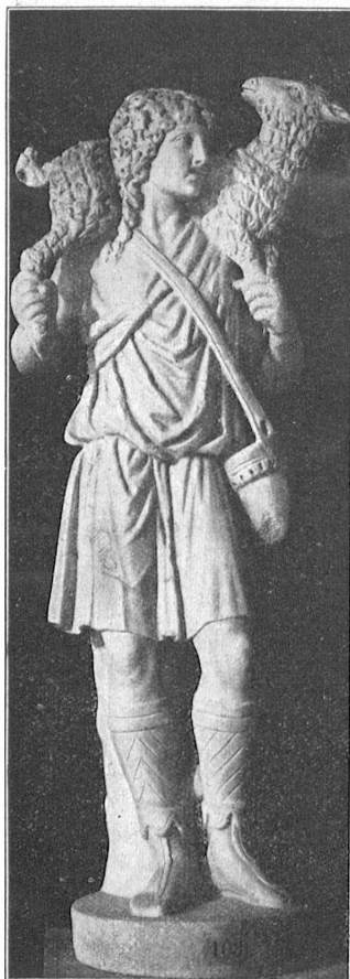
Abb. 1. Christus als „Guter Hirte“ (Lateran Rom), 7. Jahrhundert, ein späteres Beispiel der griechisch-mythologischen Auffassung der Person Christi.

denn ihr Sinn und Inhalt ist nicht die historische Begebenheit, sondern die reine Lehre. Es kann in diesem Zusammenhange nicht einmal beitragen, daß uns auch sonst keine zeit-