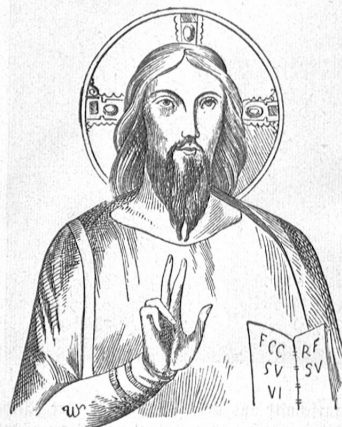
Abb. 7. Christuskopf aus S. Gaudio in Neapel, edler, hagerer, aber wirklichkeitsgetreuer Christustyp.