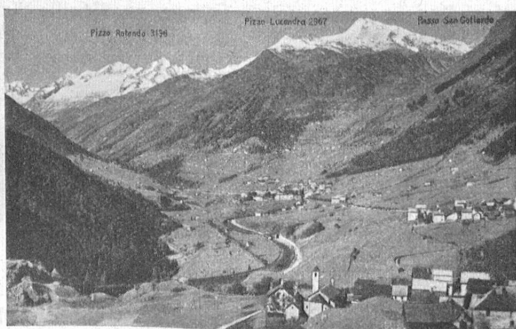
Airolo. Blick gegen das Bedretto.

Airolo nennt tüchtige Männer sein eigen. Unter ihnen treten die Annexia, Cerro, Dotta, Lombardi und Motta hervor. Die Annexia waren die Schloßherren an der Stal-