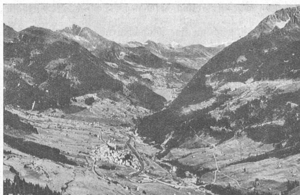
Airolo. Blick ins Ebnental.

vedroschlucht; Giacomo wurde um 1300 in den Streit über den Besitz der Leventina verwickelt. Alberto Cerro, im 13. Jahrhundert Bogt der Leventina, zettelte gegen die