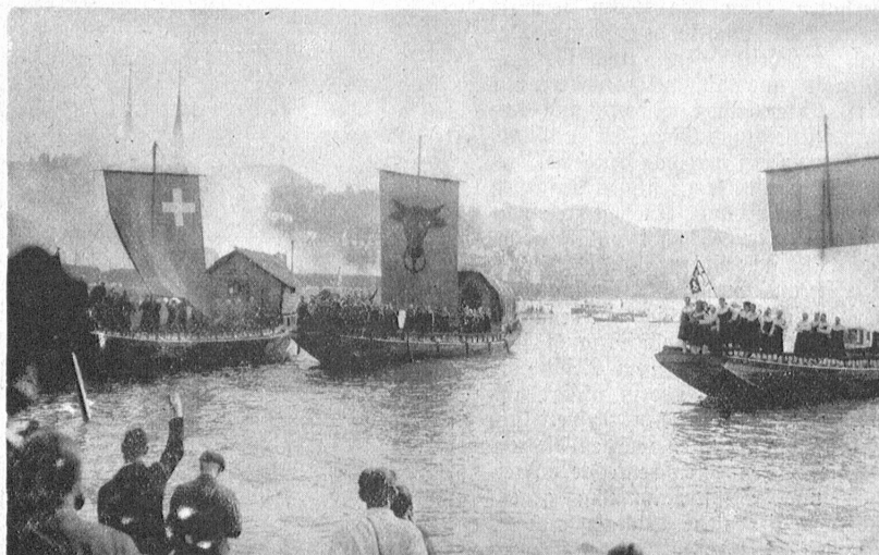
Lucerns Sechshundertfeier, 11. September 1932. Die Rauen der Urkantone landen unter Kanonendonner.

Der Waldweg holpert zwischen den Bergtannen durch, schaut bald rechts in eine kleine Lichtung, möchte bald links