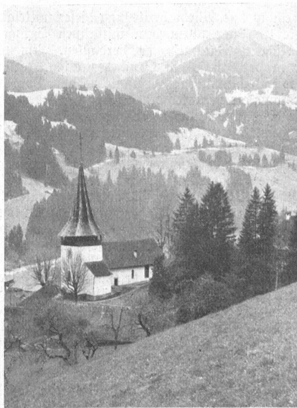
Die Kirche von Erlenbach.

Blick ins breit und freundlich sich öffnende Diemtigtal steigen wir rechts zu dem „Bergli“ genannten schönen Wiesenplateau hinauf, von wo wir, das Simmental überschauend, auf