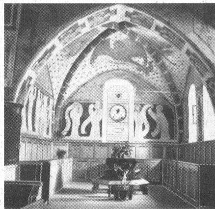
Blick in das restaurierte Chor der Kirche von Erlenbach i. S.

Hat man unter den schattigen Kirchhofsbäumen hindurch