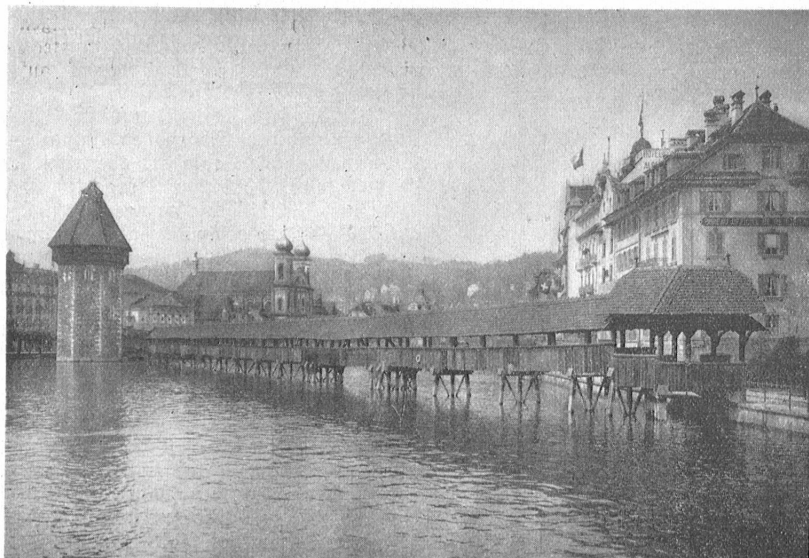
Lucerne. Die um 1300 erbaute Kapellbrücke bildete die erste Verbindung zwischen beiden Reussufern. Der Wasserturm links ist das älteste erhaltene Bauwerk der Stadt und dient heute als Archlv.

Bischofs von Konstanz an, ohne Erfolg. Da wurde am 16. April 1291 Luzern an den Grafen und später Kaiser Rudolf von Habsburg verkauft. Damit war die Stadt zu einem österreichischen Grenzort geworden. Wir sind nicht darüber orientiert, wie die Luzerner diesen Herrschaftswechsel aufnahmen. Auf alle Fälle huldigten sie am 31. Mai 1292 ihrem neuen Herrn, der ihnen gleichzeitig die „Rechte und guten Gewohnheiten“ rückhaltlos bestätigte. Die Habsburger suchten die Stadt wirtschaftlich kräftig zu fördern. Das Verhältnis zu den Waldstätten wurde aber vorübergehend getrübt. Fehden hemmten den lokalen Verkehr und die Warenzüge über den Gotthard. Am 22. Januar 1309 kam es zu einem Sühnevertrag. Die Waldstätter gaben „dem Schultheißen, dem Rat und der Gemeinde Luzern Frieden auf dem See für Kaufleute und Knechte, die in der Burger Schiffen Kaufmannsgut bis an die Susz zu Flüelen führen und wieder nach Luzern zum Tor und an den Hof“. Im Jahre 1315 allerdings kämpften die Luzerner am Morgarten mit den Österreichern gegen die Waldstätte, wie bereits bemerkt.