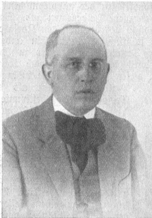
Prof. Dr. Jonas Fränkel, Bern

Fränkel bildet nämlich eine ungemein hoch zu wertende Ausnahme unter den Schrifttumforschern und Herausgebern. Jede Ausgabe, um die er sich bemüht, gedeiht schlechterdings zu „der“ Ausgabe. Denn er weiß unerhört viel, er verfügt über eine nie versagende Belesenheit, was ihm ermöglicht, alle Zusammenhänge seiner Stoffe zu überblicken, für seine Leser jeden wünschbaren Nutzen daraus abzuleiten. Sein vorbildliches Arbeitsgewissen, seine Feinlichkeit würden für sich allein schon hinreichen, ihn zu einem bedeutenden Herausgeber zu stempeln. Aber bei ihm kommt noch das Wesentlichste, Seltenste hinzu: — Fränkel tritt durchaus unbefangenen, vorurteilsfrei an Keller heran. Es ist diesem Gelehrten eine