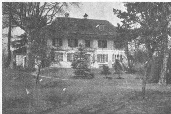
Der „Stod“ in Leuzigen.

bezahlen; Reisenden, die sich eine Krankheit zugezogen hatten, gewährte man Obdach und Pflege, bis sie sich zum Weitermarsch stark genug fühlten. Erlag einer seinem Sied-