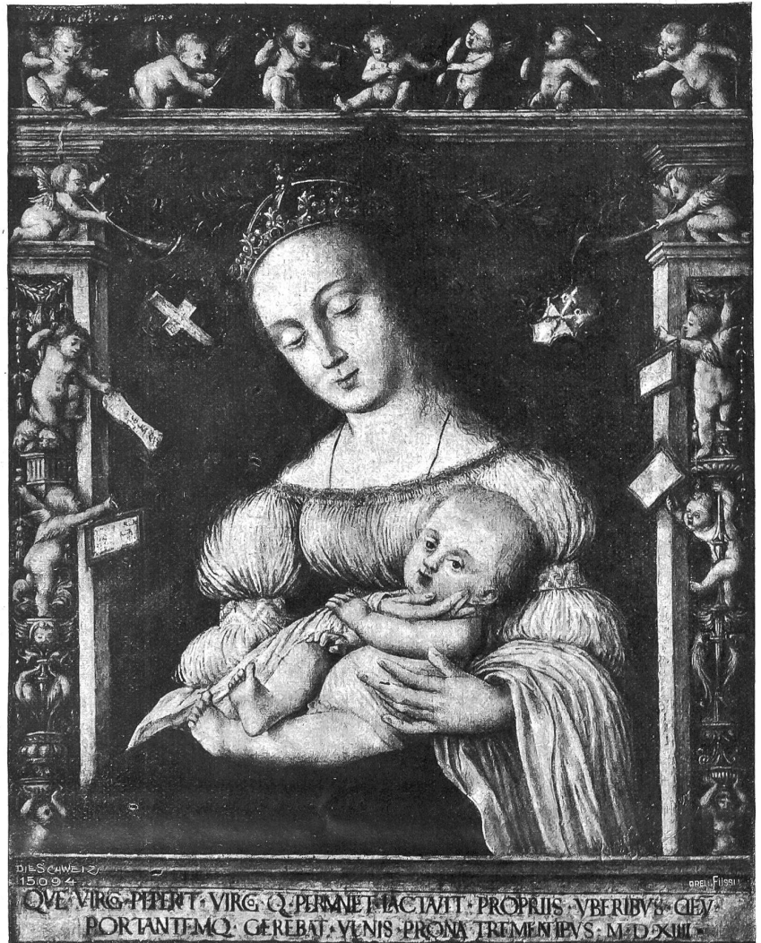
Hans Holbein: Madonna mit Kind.

In dem kleinen Dorfe verbreitete sich blühschnell die Kunde von dem ungeladenen Weihnachtsbesuch bei Widmers. Im einzigen Spezereiladen des Ortes, in welchem wie in einem Basar alles Mögliche zu haben war, standen die Käuferinnen in erregtem Gespräche zusammen. Und es war merkwürdig, wie dieses Ereignis am Weihnachtsabend die Frauen zu einer scheuen und rücksichtsvollen Beurteilung zwang. Als ob am heutigen Tage unter dem Eindruck dieses nahen Geschehens das Licht, das durch die Zeitenferne aus jenem armen Stalle aus Bethlehem glänzte, mit einem besonderen und milden Mahnen an ihre Herzen rühre. Kein hartes, liebloses Wort wurde gehört, keine hämischen Bemerkungen wurden ausgetauscht, und so wortreich man sich auch über die dürftigen Einzelheiten dieser Begebenheiten erging, so verurteilte doch niemand das Mädchen, das in dieser winterkalten Zeit gegangen war, getrieben von einer vagen Weihnachtshoffnung, den Vater seines Kindes zu suchen und in der nahenden Not seiner Stunde nieder-