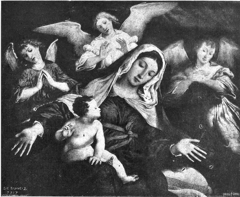
Lorenzo Lotto: Madonna mit drei Engeln.

hinter sich hatte, trugen ihre Füße sie nicht mehr, und mit einem wehen Schmerzenslaut sank sie nieder. Sie schlug die Hände vor die Augen und wimmerte: „Herrgott, erbarme dich meiner! Heute ist ja der Heiland geboren!“